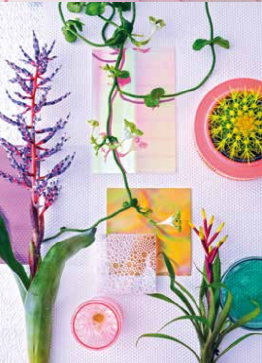
Des effets de profondeur