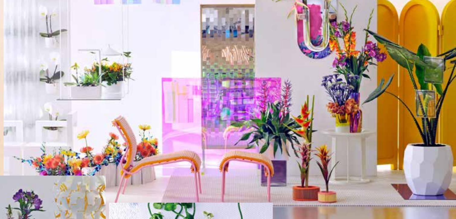
Un intérêt profond pour les plantes