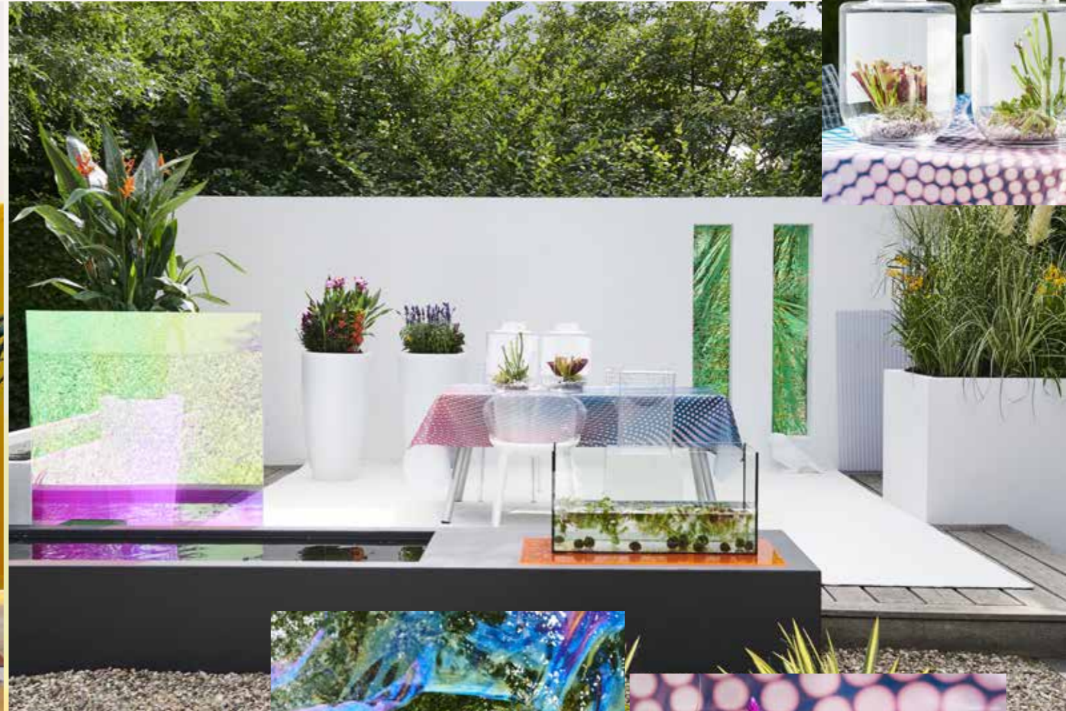
Une interaction envoûtante entre le transparent et le semi-transparent