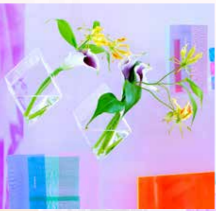
Des fondus palpitants